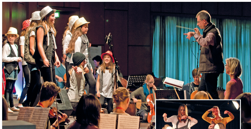
Eurode-Jugend-Orchester (EJO) und Theater-AG

Unsere Schule stellt allen Schülerinnen und Schülern einen Zugang zu einer leistungsstarken Plattform zur Verfügung (Microsoft Teams). Dokumente können gespeichert, geteilt und gemeinsam bearbeitet werden. Der Austausch in Kursen, untereinander und mittels Videokonferenzen ist in einem geschützten Bereich möglich, den nur Mitglieder der Schulgemeinschaft betreten können. Alle Schülerinnen und Schüler erhalten ein kostenloses Office 365 Paket und haben mit diesem ebenfalls Zugriff auf eine herunterladbare Version von Microsoft Office.