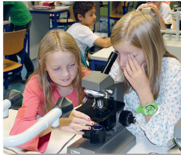
Mikroskopieren in einem der vielen Fachräume

Im künstlerisch-musikalischen Bereich der Schule stehen den Schülerinnen und Schülern atelierartige Fachräume zur Verfügung.