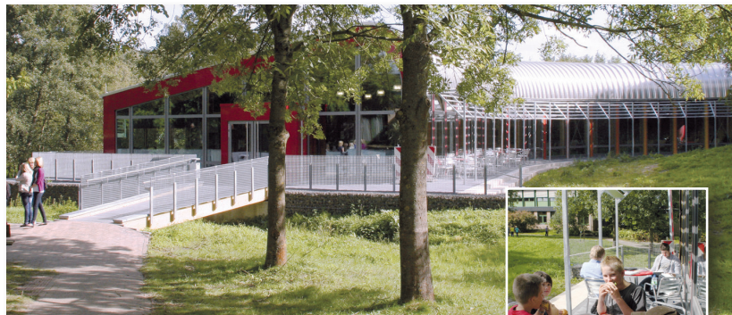
Mensabereich der Schule

Das Schulgelände wird von den meisten Schülerinnen und Schülern über gute Schulbusverbindungen erreicht, viele kommen auch mit dem Fahrrad.