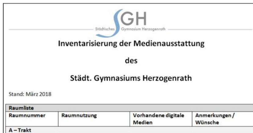
Abbildung: Ausschnitt der Inventarliste

Die Ausstattung der Klassen- und Fachräume am Städtischen Gymnasium Herzogenrath wird durch die Arbeitsgruppe Medien geplant und mit den verschiedenen beteiligten Gremien innerhalb der Schule abgesprochen. Als Grundlage zur Erfassung der einzelnen medialen Ausstattungen dient eine Inventarliste .