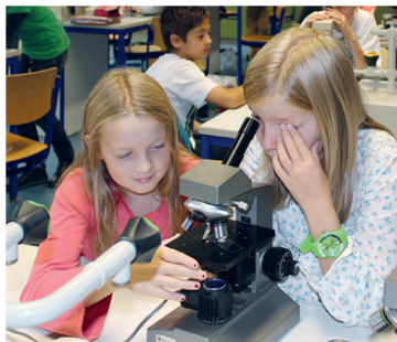
Mikroskopieren in einem der vielen Fachräume

Im künstlerisch-musikalischen Bereich der Schule stehen den Schülerinnen und Schülern atelierartige Fachräume zur Verfügung.