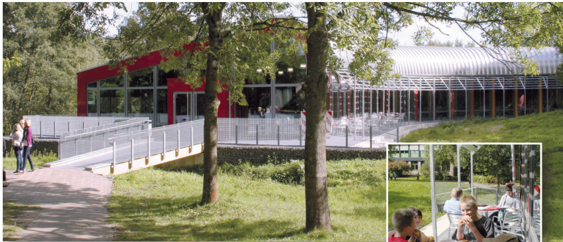
Mensabereich der Schule

Das Schulgelände wird von den meisten Schülerinnen und Schülern über gute Schulbusverbindungen erreicht, viele kommen auch mit dem Fahrrad.