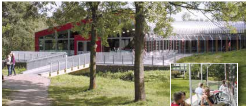
Mensabereich der Schule

Das Schulgelände wird von den meisten Schülerinnen und Schülern über gute Schulbusverbindungen erreicht, viele kommen auch mit dem Fahrrad.