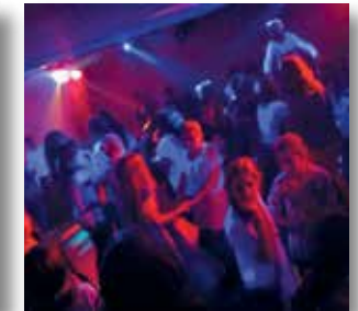
Patenschaften und PansDäns

Die erste Fremdsprache ist Englisch. In der Jahrgangsstufe 6 (Wahlpflichtbereich I- WPI) werden als zweite Fremdsprache Französisch und Latein zur Wahl gestellt. Während der Erprobungsstufe wird regelmäßig über die Entwicklung der Schülerinnen und Schüler beraten. Am Ende der Erprobungsstufe entscheidet die Klassenkonferenz über ihre gymnasiale Eignung.